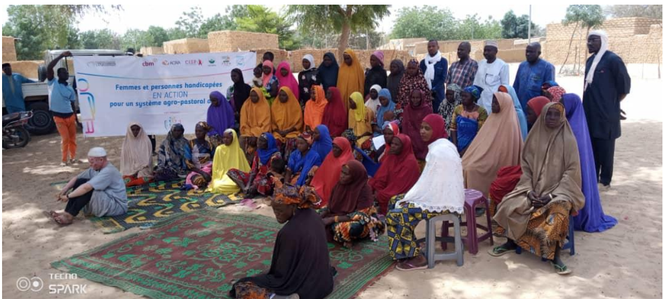
Figura 2: Formazione dei produttori locali sulle buone pratiche igieniche e sulla raccolta e lavorazione del latte