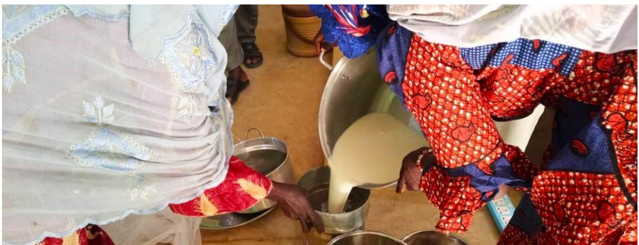
Figura 3: Formazione dei produttori locali sulle buone pratiche igieniche e sulla raccolta e lavorazione del latte