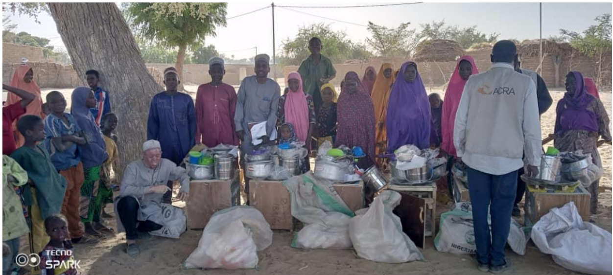
Figura 5: Distribuzione di kit per la raccolta e lavorazione del latte